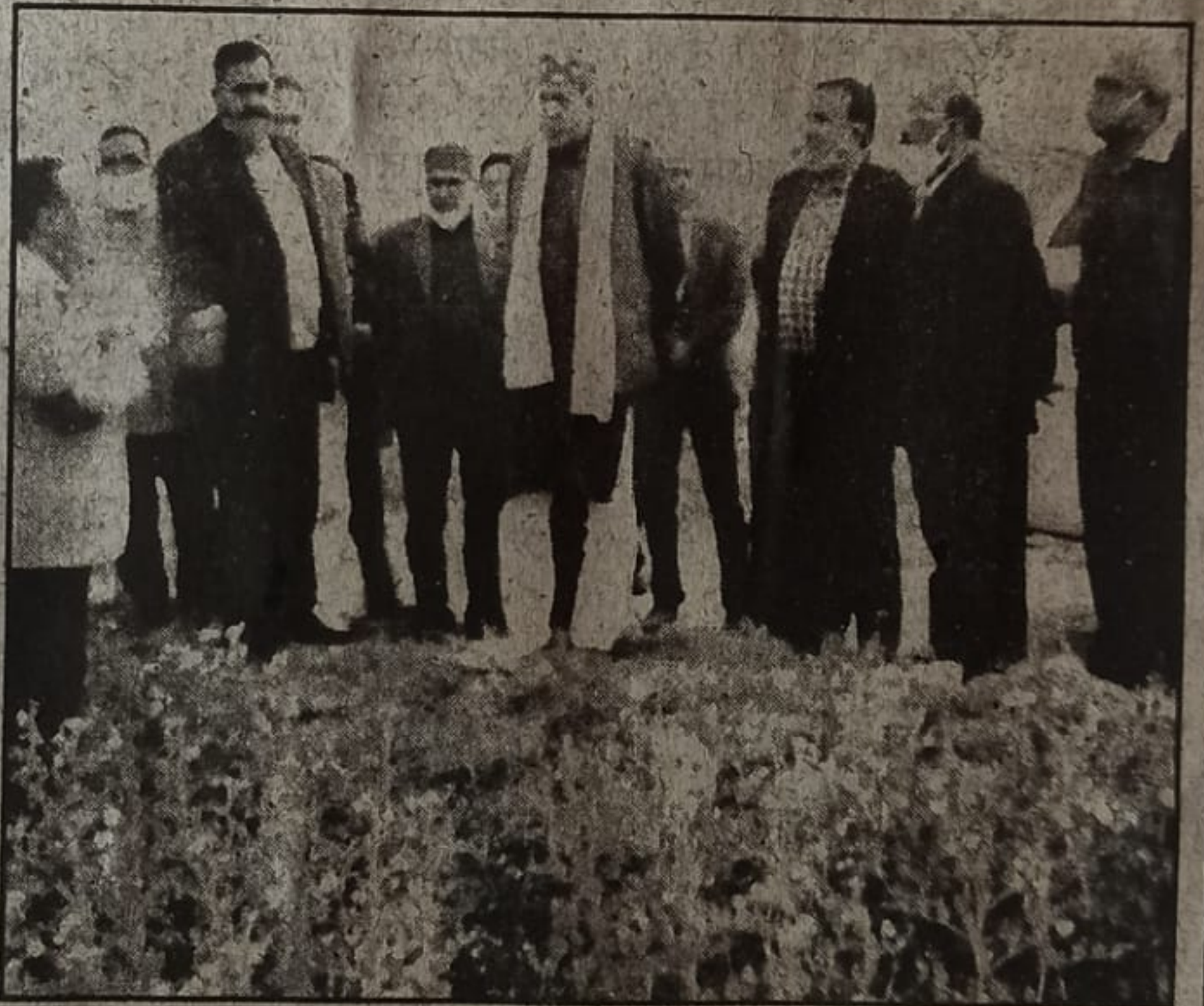
कृषि फार्म का निरीक्षण करते मंत्री सूर्य प्रताप शाही व अन्य।

■ कल्याणपुर के नवीन फार्म, छात्रावास भी पहुंच गये