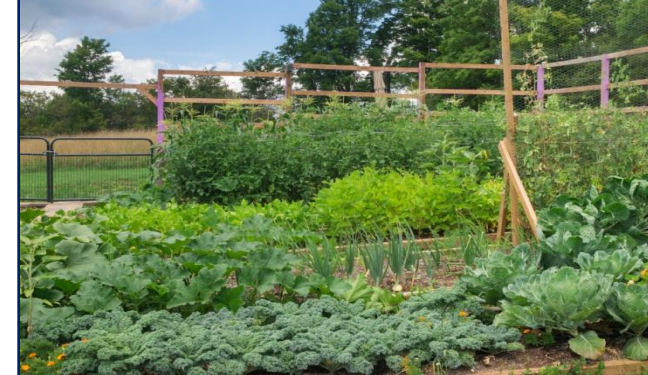
पोषण सुरक्षा (पोषक थाली, स्वास्थ्य आधार)