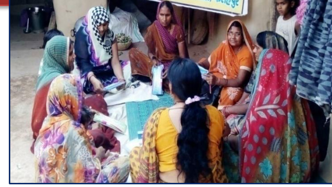
पूंजी स्वावलम्बन (बचत खर्च का सही अनुपात)