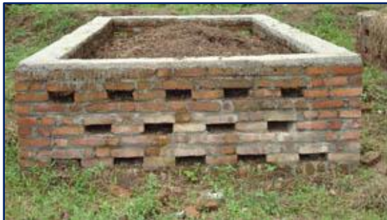
भूमि स्वास्थ्य संतुलन (खेत चाहे पकी कम्पोस्ट)