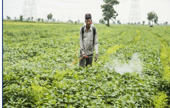
फसल सुरक्षा (खेत, खलिहान, भण्डार कीट मुक्त)