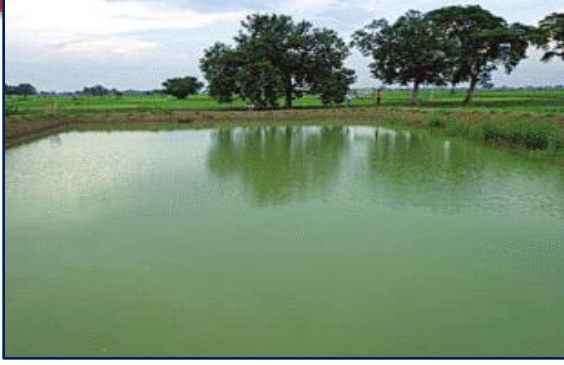
जल संरक्षण प्रबन्धन (मोटी मेड़, छोटे खेत)