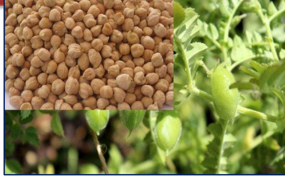
बीज खेत तकनीक (खेत जो चाहे वही प्रजाति)