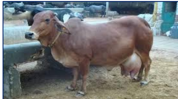
पशु प्रबन्धन (कम पालो, उन्नत पालो)