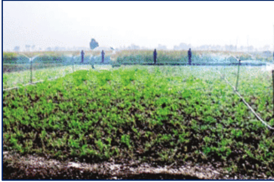
नमी संरक्षण (हाथ में खुरपी, कांध कुदाल)