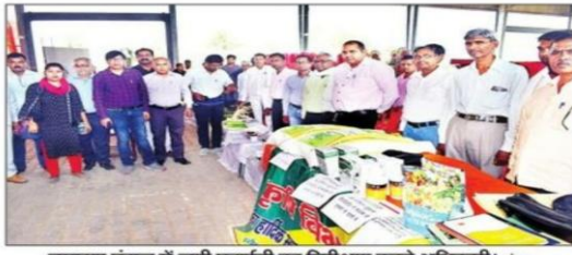
नुमाइरा पंडाल में लगी प्रदर्शनी का निरीक्षण करते अधिकारी। संवाद