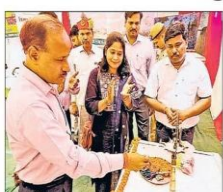
श्री. सरकारी जमीन पर प्राथमिकी के कालांतर में सौजन्य रह गया है, उन्हें भी पावर दिया जाएगा।

फसल बढ़ाए, संवदना। किसान को जैविक खेती करने से अधिक लाभ मिलेगा। जो कि अनेक तरीकों से बताया गया है। जैविक खेती करने से किसानों को अधिक मुनाफा मिलेगा। जो कि अनेक तरीकों से बताया गया है। जैविक खेती करने से किसानों को अधिक मुनाफा मिलेगा। जो कि अनेक तरीकों से बताया गया है। जैविक खेती करने से किसानों को अधिक मुनाफा मिलेगा। जो कि अनेक तरीकों से बताया गया है।