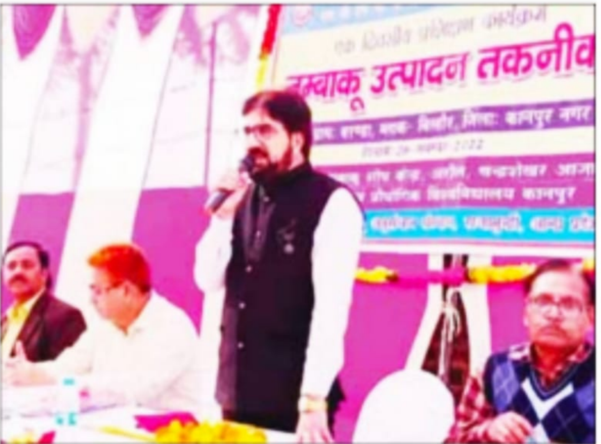
कार्यक्रम को सम्बोधित करते मुख्य वक्ता।

प्रतिशत उत्पाद शुल्क में हिस्सा है, जिससे 9000 करोड़ रुपए देश के तंबाक् उत्पादक व इससे जुड़े पदार्थों से प्राप्त होता है। उन्होंने किसान भाइयों को बताया