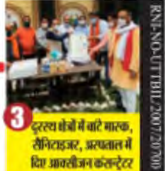
3 दूरस्थ घंटों में चाटे मास्क, सैनिटाइजर, अस्पताल में दिए आवसीजन कंसन्ट्र