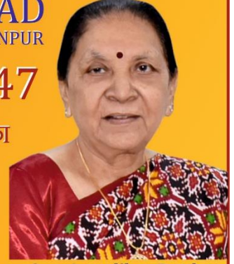
Smt. Anandiben Patel Hon'ble Chancellor and Governor of Uttar Pradesh