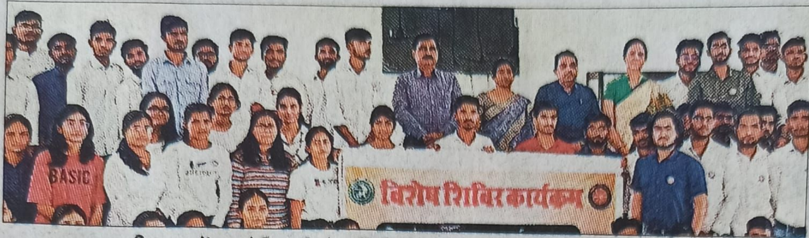
सीएसए में आयोजित विशेष शिविर में मौजूद विद्यार्थी व अधिकारी। संवाद