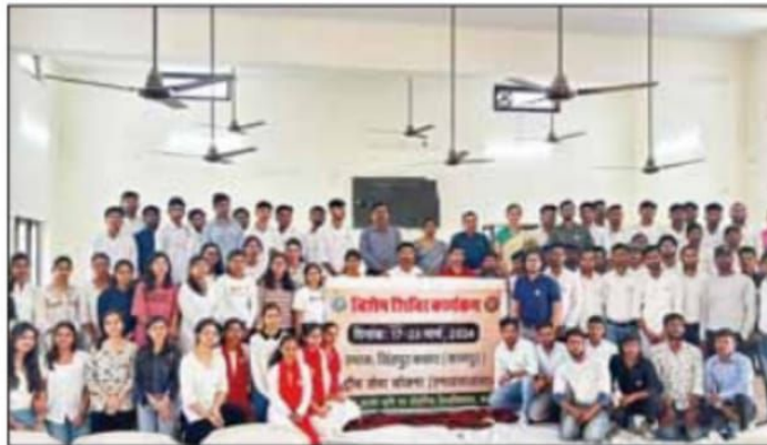
विशेष शिविर कार्यक्रम।

उद्घाटन संबोधन में कुलसचिव द्वारा कहा गया कि समाज सेवा के माध्यम से विद्यार्थियों का व्यक्तित्व विकास करना ही राष्ट्रीय सेवा योजना का लक्ष्य है। उन्होंने कहा कि शिविर के माध्यम से विद्यार्थियों में सृजनात्मक एवं रचनात्मक सामाजिक कार्यों के प्रति रुचि विकसित होगी तथा लोगों के साथ