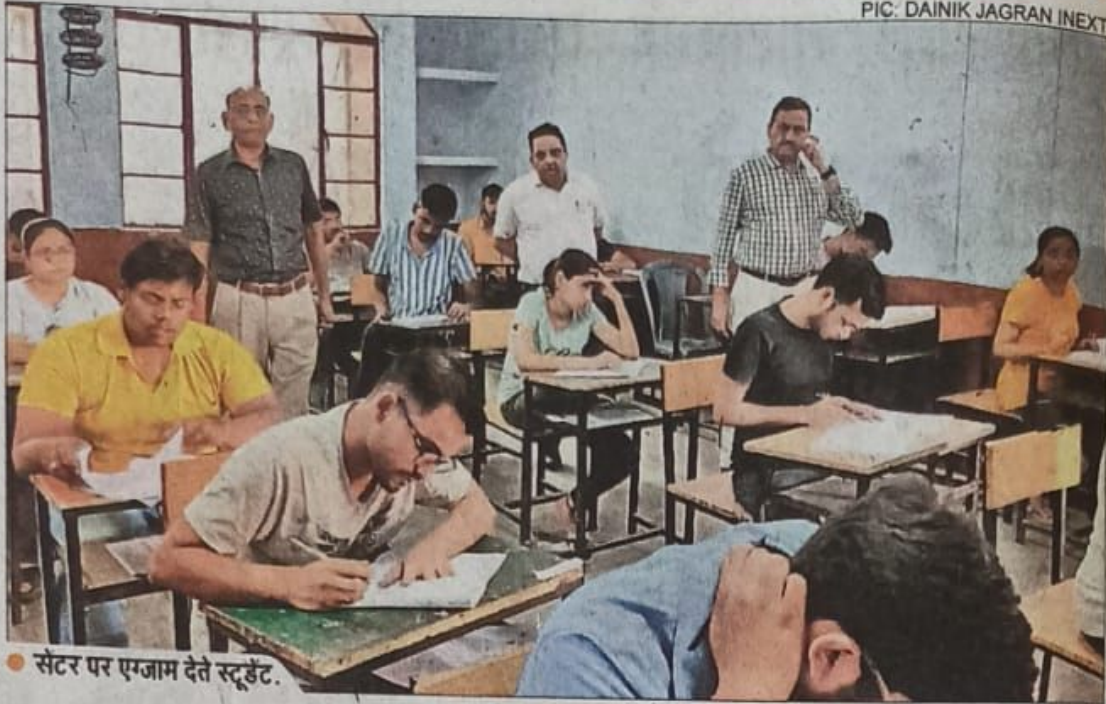
● सेंटर पर एग्जाम देते स्टूडेंट.

पूज टीडी की किया ड्रोन क उड़ने में ग में ड्रोन नगभग वेत सक्षम है ये