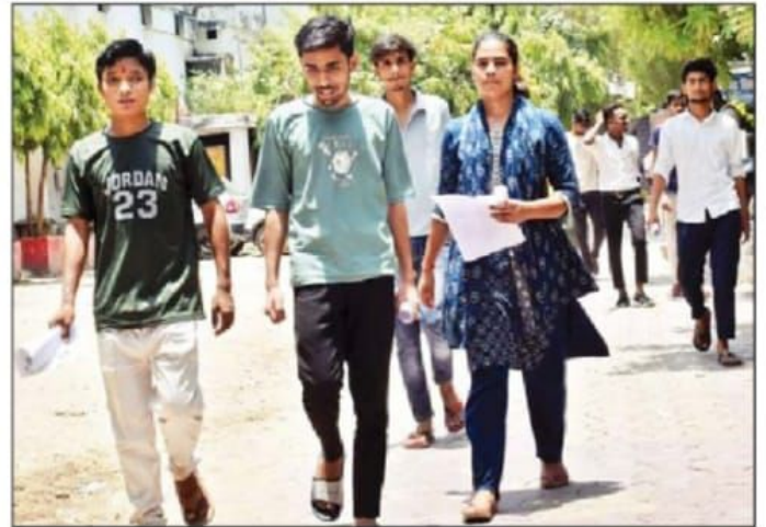
कैटेगरी : एसएनवी