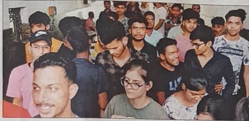
कानपुर विद्या मंदिर में यूपी कैटेट की परीक्षा देकर निकलते परीक्षार्थी।

यूपी कैटेट 2024 का आयोजन सरदार वल्लभभाई पटेल कृषि एवं प्रौद्योगिकी विवि मेरठ की ओर से कराया जा रहा है। इससे कानपुर, अयोध्या, मेरठ, बांदा और कुशीनगर स्थित राज्य कृषि विवि में यूजी, पीजी और पीएचडी कोर्स में दाखिला मिलता है। शहर के छह केंद्रों पर यूपी के पांच कृषि