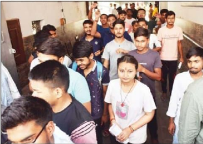
यूपी कैटेगरी की परीक्षा देकर केंद्रों से बाहर निकलते परीक्षार्थी।